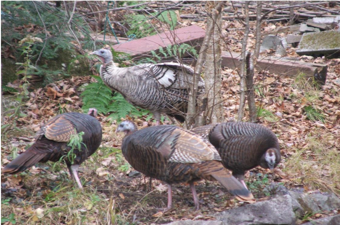
Clement Boisvert's visiting wild turkeys