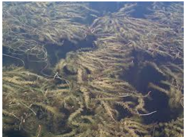
Myriophylle à épi

Si vous rencontrez un bateau suspect sans décalcomanie, vous pouvez expliquer à l'étranger qu'il s'agit d'un lac privé sans accès public; les personnes utilisant une embarcation sans décalcomanie ou les invités d'un résident devraient être invités à retirer leur bateau afin de protéger le