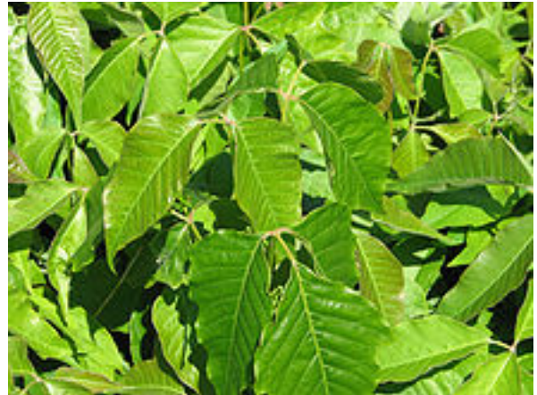
L'herbe à puce florissant au sol

plantes suspectes, avisez le comité aussitôt que possible pour qu'on puisse agir immédiatement. Voici ce qu'ont l'air ces plantes qui au contact causent une dermatite.